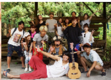
夏の川遊び &キャンプ