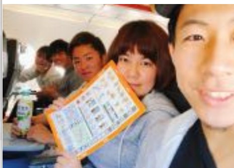
住人みんなで！ 沖縄旅行