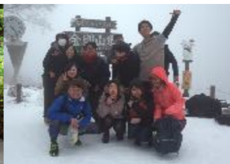
一面銀世界！ 冬の雪山登山