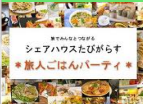
海外料理に挑戦 旅人ごはん会