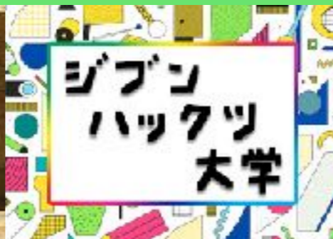
自分を再発見！ ジブンハックツ大学